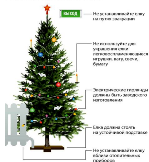
Установка и украшение елки

Запомните, что перед тем, как поджечь фитиль, вы должны точно знать, где у изделия верх и откуда будут вылетать горящие элементы.