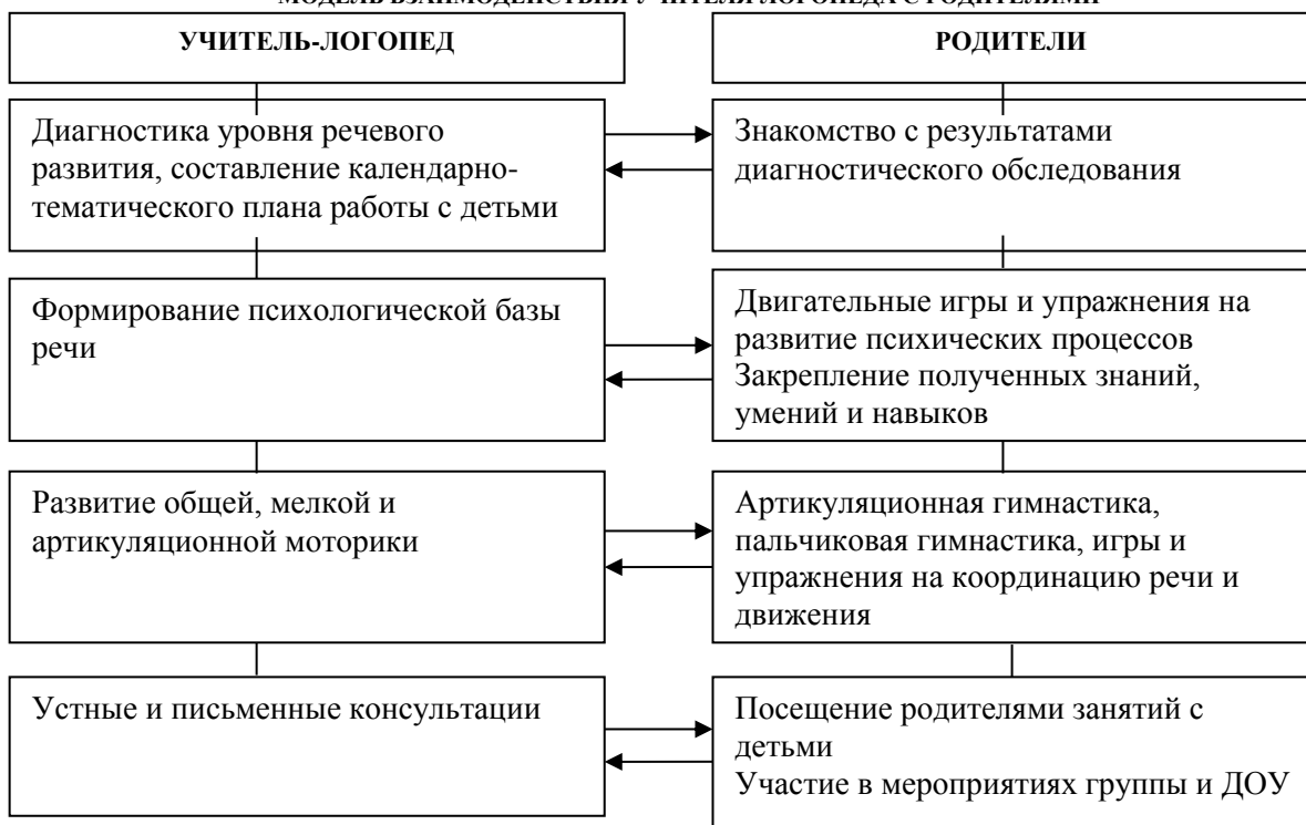
МОДЕЛЬ ВЗАИМОДЕЙСТВИЯ УЧИТЕЛЯ ЛОГОПЕДА С РОДИТЕЛЯМИ

Без постоянного и тесного взаимодействия с семьями воспитанников коррекционная работа будет не полной и не достаточно эффективной. Поэтому интеграция детского сада и семьи – одно из основных условий работы учителя-логопеда в группе комбинированной направленности (детей с ОНР). Взаимодействия с семьями детей, имеющими нарушения речи, отражено в модели: